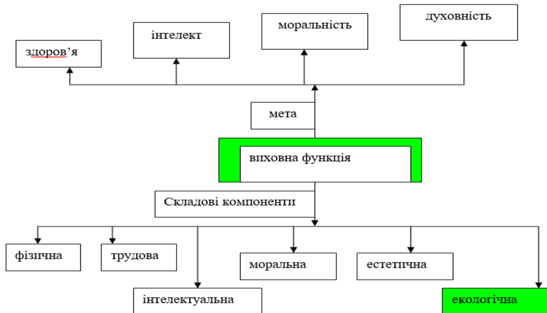
Рис. 2. Зміст виховної функції (Джерело: Яблонська, 2004).

створюються умови для оволодіння національним та світовими надбаннями. З кожним кроком дитини виховується потреба створювати навколо себе красу.