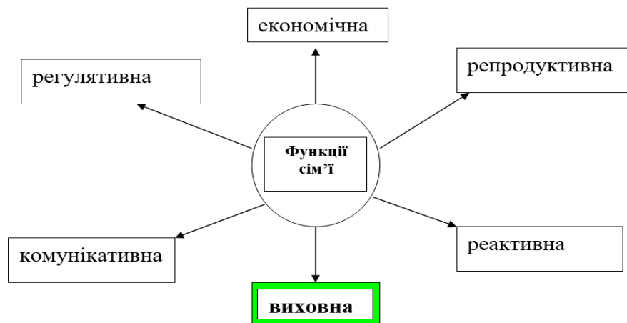
Рис. 1. Функції сучасної сім'ї (Джерело: Яблонська, 2004).

Розглядаючи виокремлені Яблонською (2004) функції сім'ї, звернемо увагу на те, що кожна із цього переліку функція осмислена диференційовано. Зокрема, авторка пояснює, що виховна функція сім'ї полягає в передаванні нащадкам необхідних для життя і господарювання знань, умінь і навичок, норм, цінностей та традицій, що дозволяє передати молодшому поколінню соціальний досвід, зумовлюючи їхнє входження в систему суспільних відносин. Забезпечення статусності сім'ї як повноцінної господарської одиниці є важливою умовою добробуту, духовного, психічного, фізичного, розвитку всіх її членів, що реалізовується через економічну функцію . Відтворення й продовження людського роду, фізичне й духовне поновлення здорового суспільства покладається на репродуктивну функцію сім'ї. Збереження здоров'я членів родини, їхньої життєвої активності; дотримання норм і правил праці й відпочинку, харчування, особистої гігієни виконує реактивна функція сім'ї. Характер діяльності членів сім'ї та особливості реалізації влади й авторитету батьків забезпечує систему регулювання взаємовідносин між членами родини, а саме первинний соціальний контроль. Це є регулятивною функцією сім'ї, яка здійснюється насамперед шляхом засвоєння членами родини моральних норм, особистого авторитету, зокрема, авторитету батьків. Регулятивна функція виявляється також у налагодженні взаємостосунків усіх членів родини з суспільством, соціальними інститутами,