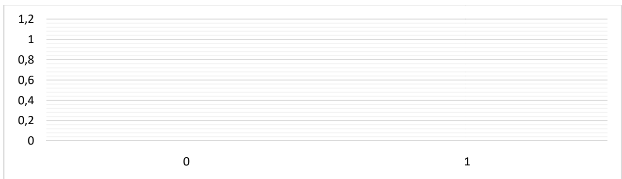
Рис. 1. Кількість тимчасово переміщених осіб по Україні (за даними Міністерства соціальної політики та Міжнародної організації міграції). (Джерело: Україна: міграційна, 2022 ).

Починаючи з 2014 року в Україні збільшення кількість внутрішньо переміщених осіб залежить від періодичності та інтенсивності військових дій на території країни (рис.1).