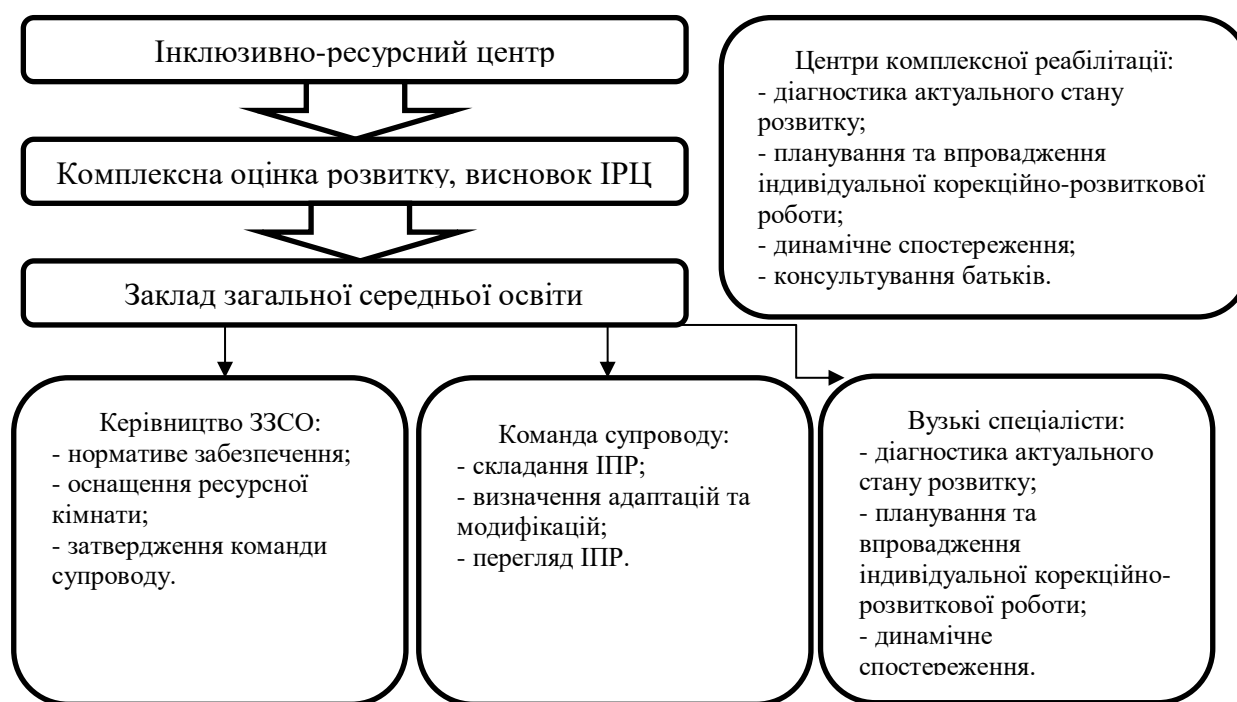
Рисунок 3. Організація корекційно-розвиткового супроводу дітей шкільного віку з інтелектуальними порушеннями

Схематичне зображення організації корекційно-розвиткового супроводу дітей шкільного віку з інтелектуальними порушеннями представлено на рисунку 3.