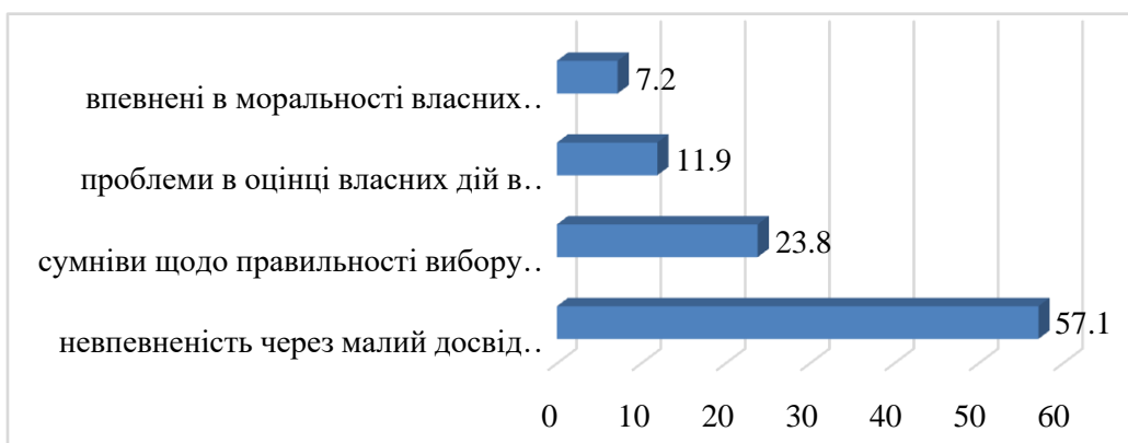
Рис. 2. Наявність сумнівів щодо толерантності власних професійних рішень (у %)

Варто зауважити, що опитані здобувачі визначили певні труднощі в професійній самореалізації у ході відповіді на запитання: «Чи виникають у Вас сумніви щодо толерантності власних професійних рішень?». Варіанти відповідей подано на діаграмі (рис. 2).